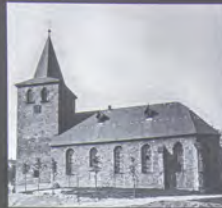
Alte Lutherkirche um 1900

Größer, schöner, städtischer: Die im Jahr 1906 eingeweihte Kirche zählt zu den Gebäuden, die zu Beginn des 20. Jahrhunderts in Wetter errichtet wurden und bis heute das Stadtbild prägen. Genauso wie der zwei Jahre zuvor fertiggestellte Bahnhof sollte auch die neue Kirche den Stolz der aufstrebenden Industriestadt widerspiegeln. Der im Stil des Historismus errichtete Bau aus Ruhrsandstein mit über 800 Sitzplätzen gilt heute als Gesamtkunstwerk und wird in Wetter aufgrund seiner Monumentalität auch „Ruhrtaler Dom“ genannt.